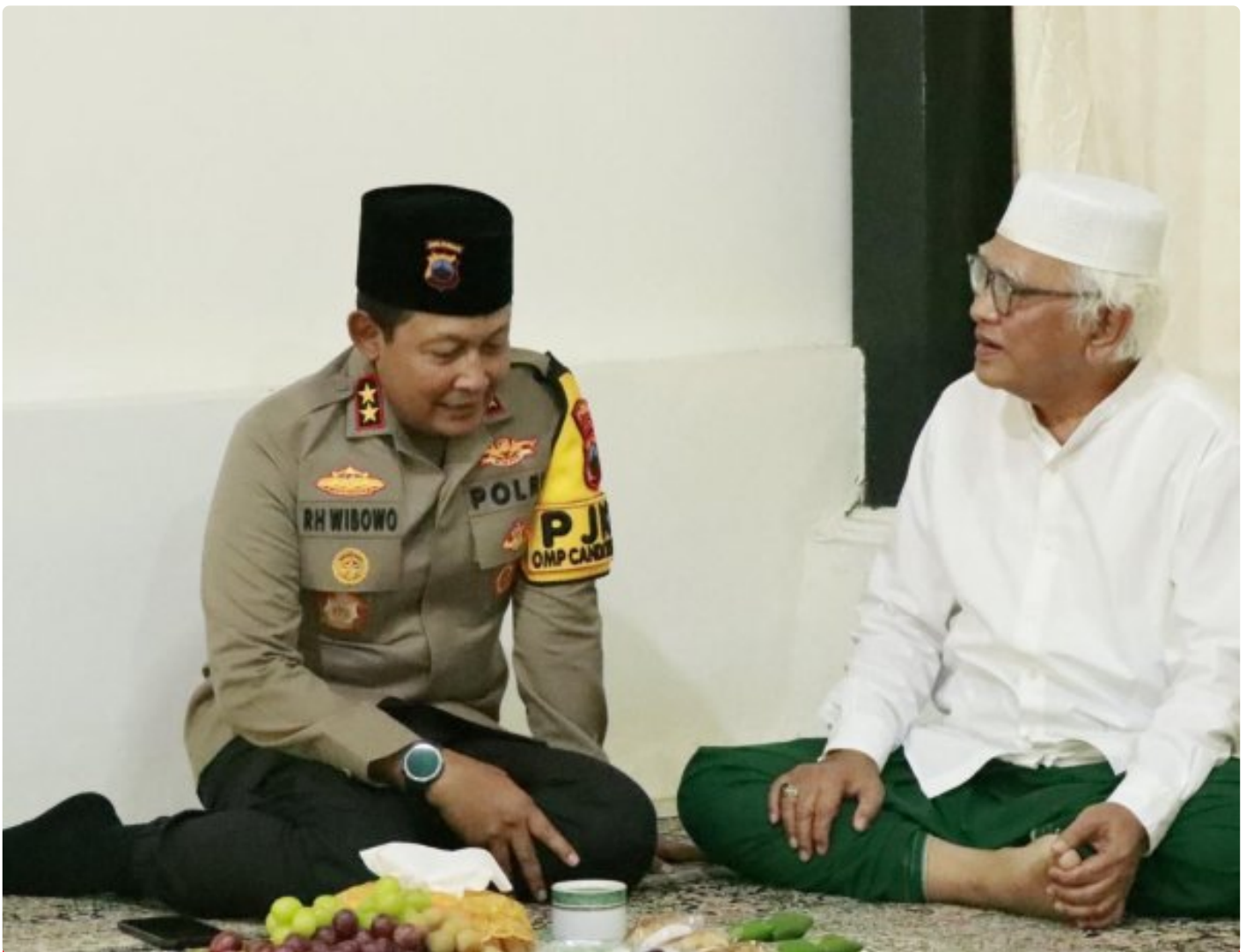
Foto: Kapolda Jawa Tengah, Irjen Pol Ribut Hari Wibowo, melakukan kunjungan silaturahmi ke sejumlah tokoh agama terkemuka di Kabupaten Rembang pada kesempatan menjelang Pilkada 2024. Senin (21/10/2024).

REMBANG- Dalam suasana hangat dan penuh kekeluargaan, Kapolda Jawa Tengah Irjen Pol Ribut Hari Wibowo mengunjungi sejumlah tokoh agama terkemuka di Kabupaten Rembang, Jawa Tengah, Senin (21/10/2024).